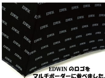
EDWINのロゴを マルチボーダーに並べました。