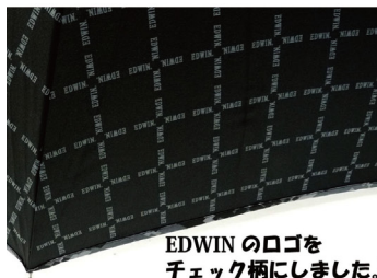
EDWINのロゴを チェック柄にしました。